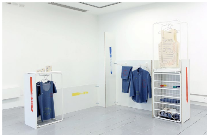
Jocelyn Villemont, Studies for A Collection , vue d'exposition à l'Intermedia Gallery, Glasgow, 2014.