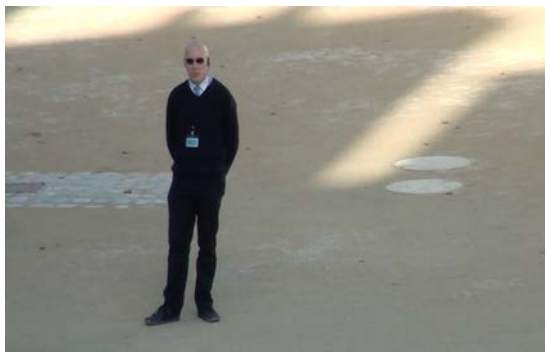
extrait vidéo #1