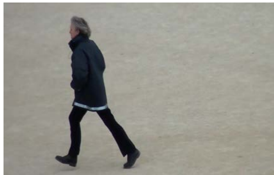
extrait vidéo #2