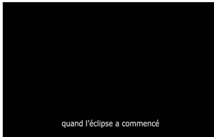
extrait #2 vidéoprojection