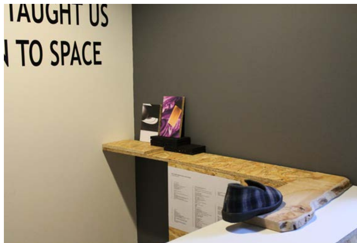
vue de l'installation #2