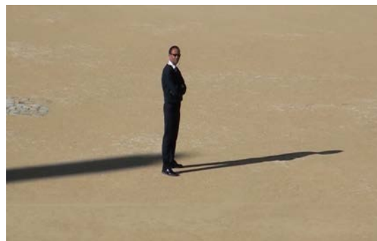
extrait vidéo 3