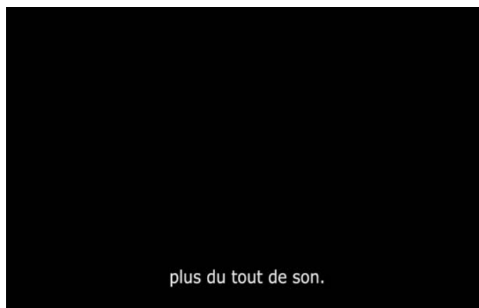
extrait #3 vidéoprojection