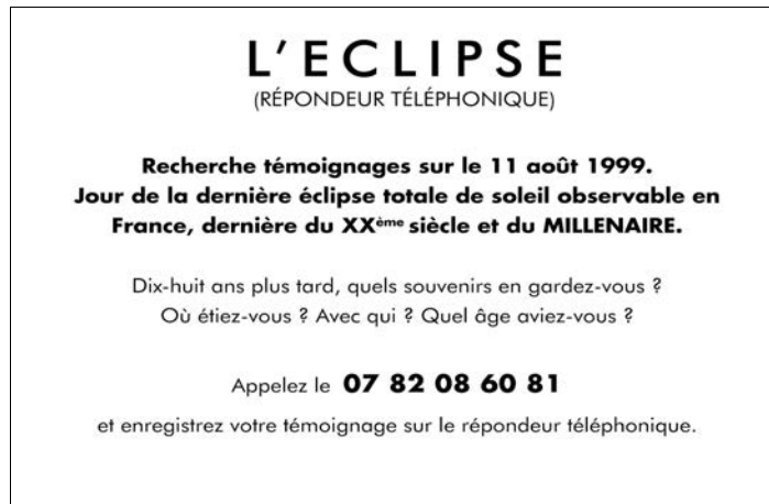
extrait #1 vidéoprojection

1- L'Eclipse (commentaires) , 2017 – vidéoprojection de sous-titrage, casques audio, 20'32" en boucle