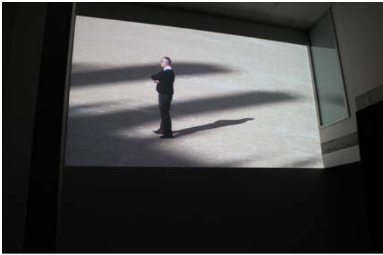
vue de l'installation vidéo #1

2 – Les gardiens , 2017 – installation vidéo, son stéréo, éclairage, périmètre de rideaux occultants, 6'30" en boucle