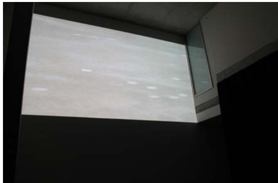
vue de l'installation vidéo #2